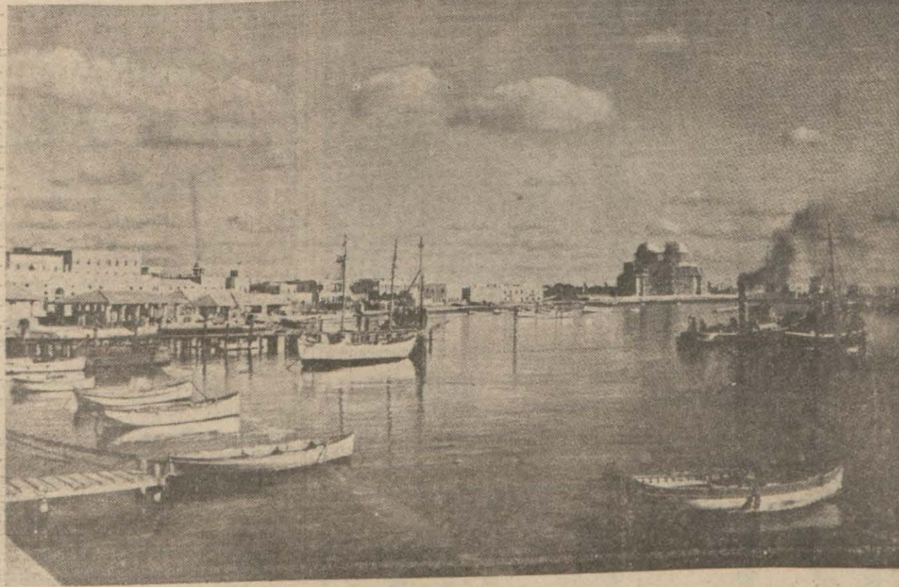
Bingazi limanından bir görünüş