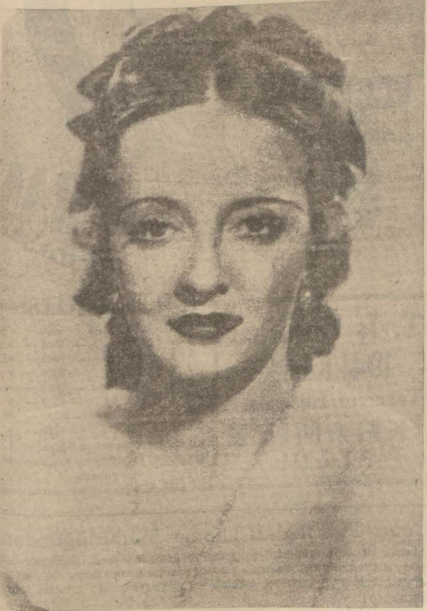
Bette Davis'in en son resimlerinden biri

Evlendiği gece bol yağmur yağdığı için bu defaki izdivacının hayırlı olacağını umuyor, çünkü, doğduğu ve san'ata intisab ettiği günlerde de yağmur yağmış ve yağmurun uğurunu denemiş