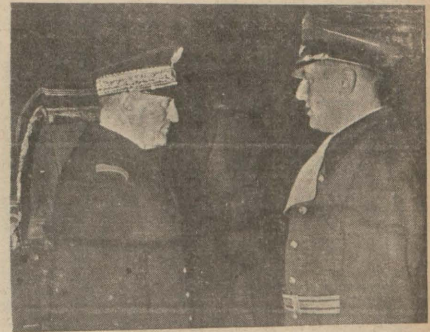
Amiral Darlan Alman büyük elçisi Abetz ile görüşürken

Bu sabah gelen haberler 3 üncü sayfadadır