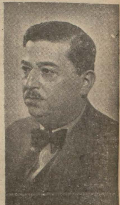
Ustadın son resmi

İşte geçen sene, ötedenberi mü - esses edebî şöhret sahiblerine: (Devamı 2 nci sayfada)